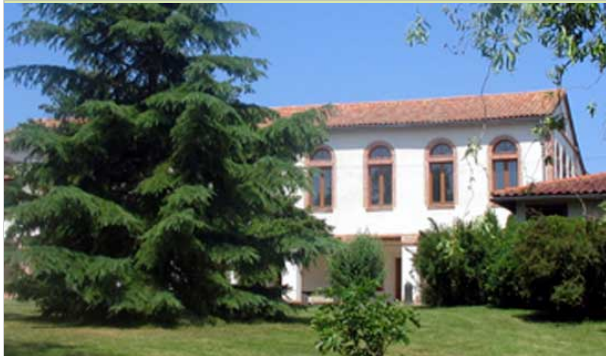
Chambres d'hôtes du Roussillon 215, chemin des Capélanios 82370 SAINT-NAUPHARY